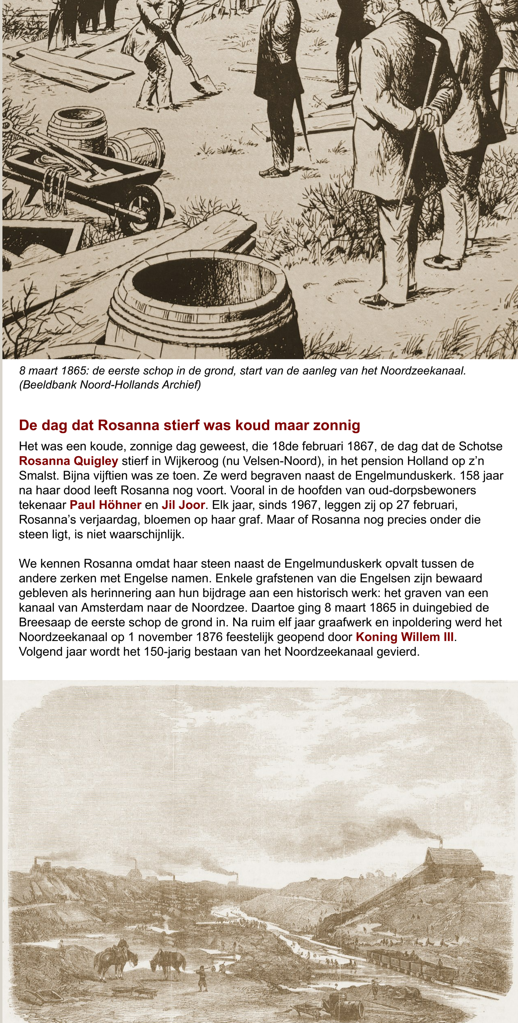
8 maart 1865: de eerste schop in de grond, start van de aanleg van het Noordzeekanaal.