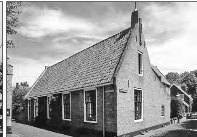
Afbeelding 6 Het huis aan het Haerlemmervoetpad na de herbouw.