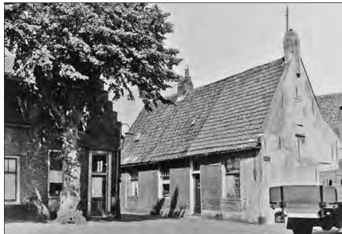
Afbeelding 2 Het huis aan het Haerlemmervoetpad kort na 1951.