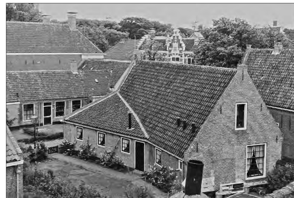
Afbeelding 7 Het huis aan het Haerlemmervoetpad na de herbouw aan de achterzijde in 1975.