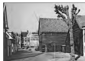
Afbeelding 4 Gezicht in de Zuiderdorpstraat, 1966. Achter de houten schuur is het huis aan het voormalige Haerlemmervoetpad weer in aanbouw.