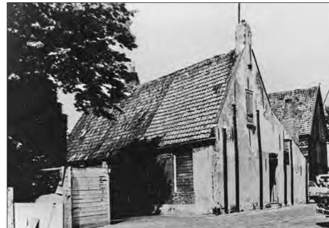
Afbeelding 5 Het huis aan het Haerlemmervoetpad in 1964. foto nr. KNA1001865.