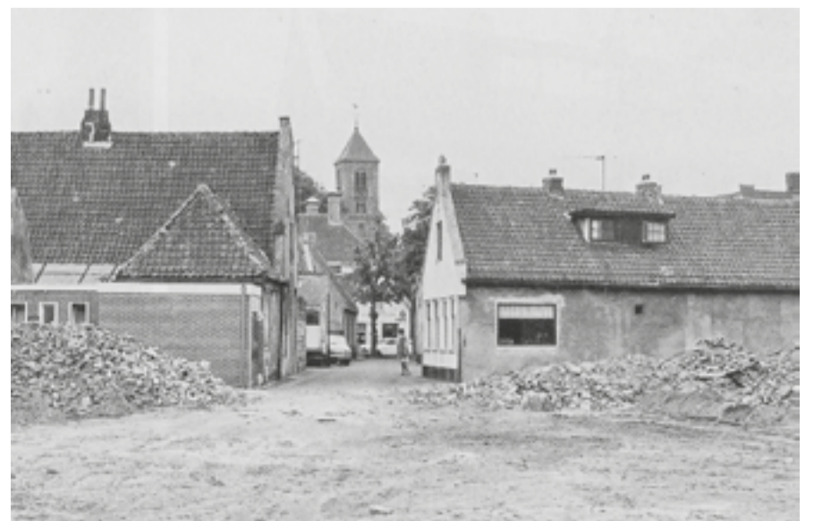
Rechts De Morgenzon vanuit het noorden. Op de voorgrond de afbraak van de woningen ten behoeve van de uitbreiding van het Noordzeekanaal.