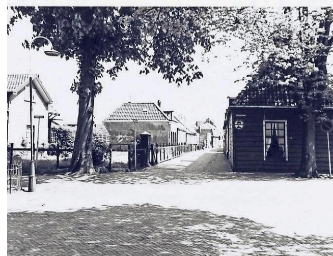
Gezicht vanuit de Torenstraat op afbraak in Noorderdorpstraat