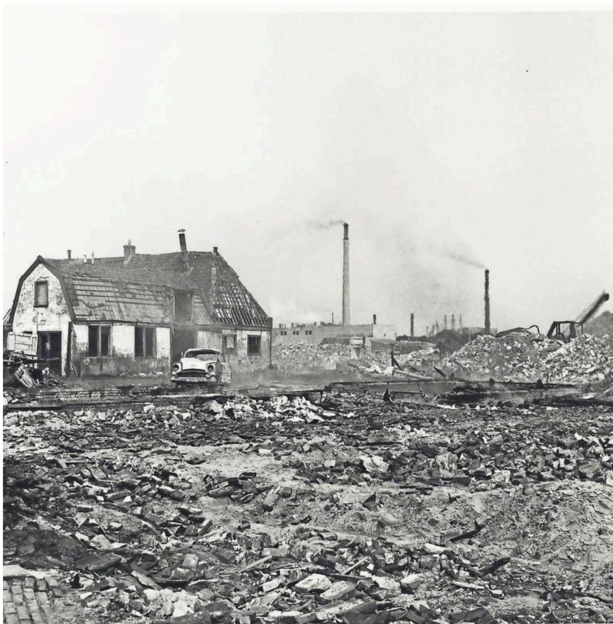
Afbraak van de bebouwing in de omgeving van de Noorderdorpstraat, gezien vanuit de Hoofdbuurtstraat zuidoostwaarts, 1969