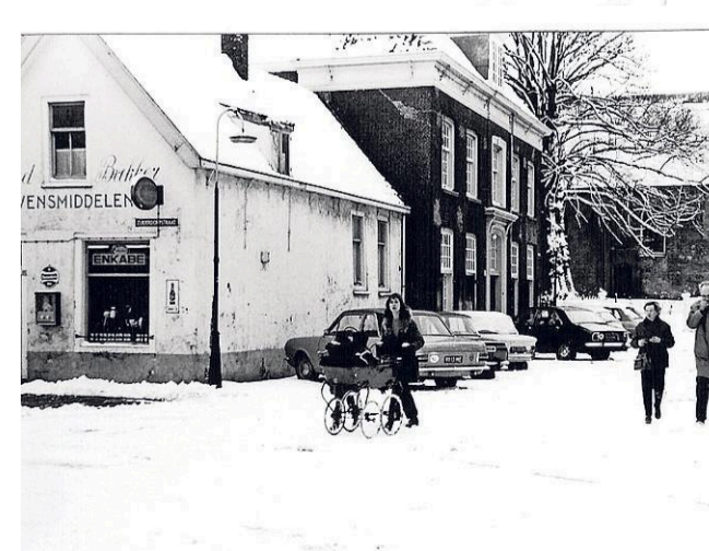
Het plein voor het oude raadhuis zuidwaarts gezien, 1965.