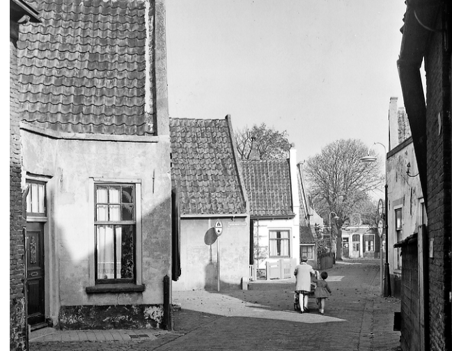
Gezicht in de Hoofdbuurtstraat noordwaarts in 1959.