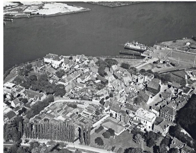
Luchtfoto uit 1923 waarop het dorp nog niet geschonden is.