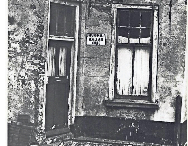
Onbewoonbaar verklaarde woning, Hoofdbuurtstraat 12, 1965.

'Herinneringen van mensen die hier zijn geboren en opgegroeid'